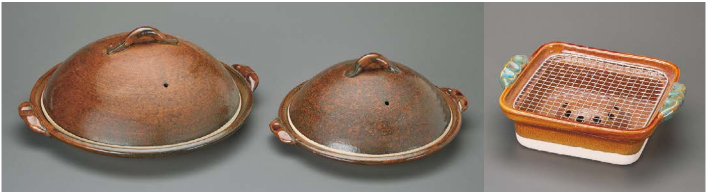
43501-438 12号陶板(蓋付) 19,800円 (360×140mm)