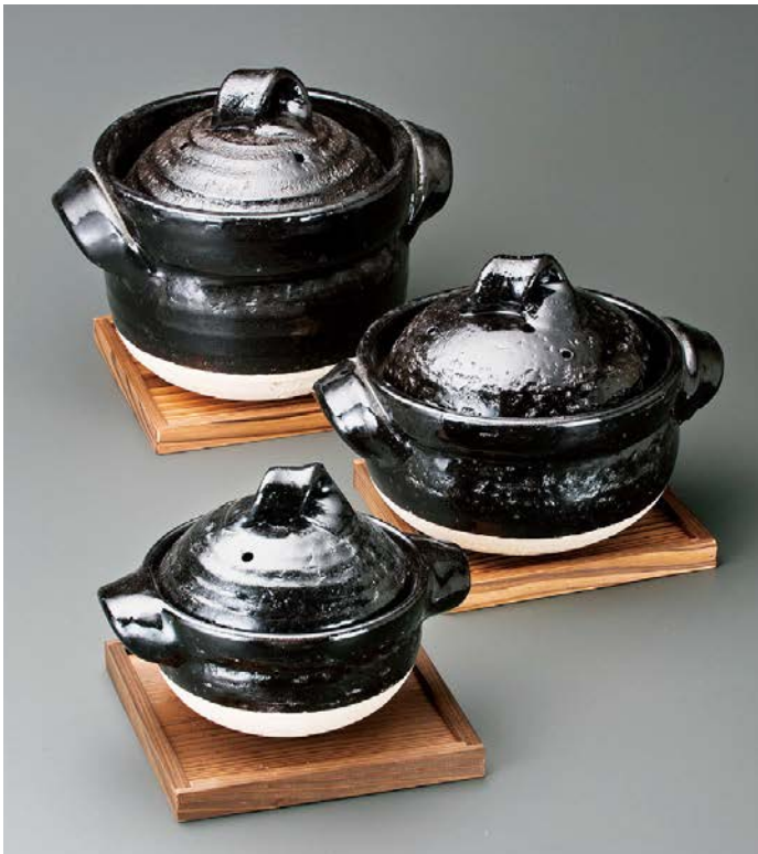
43512-438 黒釉五合御飯鍋 15,400円 (300×230×230mm) 43513-438 焼杉台 1,100円 (190×190×17mm) 43514-438 黒釉三合御飯鍋 12,600円 (290×200×190mm) 43515-438 焼杉台 1,100円 (190×190×17mm) 43516-438 黒釉一人用御飯鍋 6,500円 (220×170×160mm) 43517-438 焼杉台 1,100円 (190×190×17mm)