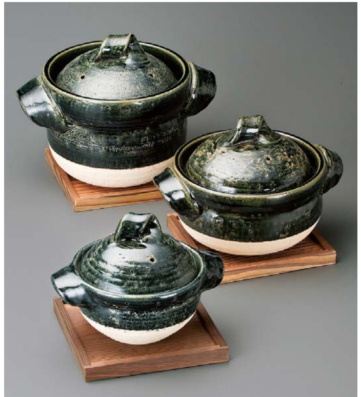
43518-438 織部五合御飯鍋 15,400円 (300×230×230mm) 43519-438 焼杉台 1,100円 (190×190×17mm) 43520-438 織部三合御飯鍋 12,600円 (290×200×190mm) 43521-438 焼杉台 1,100円 (190×190×17mm) 43522-438 織部一人用御飯鍋 6,500円 (220×170×160mm) 43523-438 焼杉台 1,100円 (190×190×17mm)