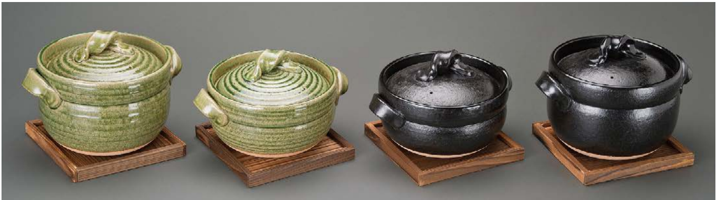
43504-438 緑釉五合御飯鍋 14,500円 (260×200×180mm)