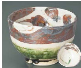
80310-458 志野織部かぶら抹茶盃(化) 3,500円 (116×80mm) 手造り