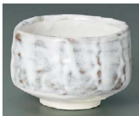
80322-218 雪志野抹茶碗(化) 3,000円 (112×80mm)