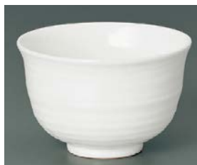
80311-128 割高台粉引抹茶盃(化) 4,250円 (120×78mm)