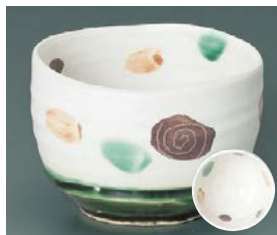
80301-338 粉引き織部抹茶碗(化) 5,300円 (128×70mm)