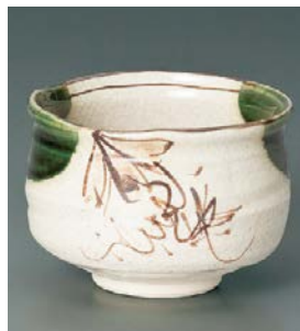
80214-128 織部抹茶碗(化) 6,700円 (120×85mm)