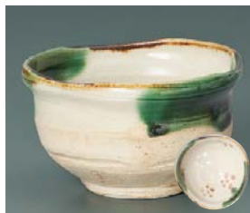
80303-338 織部内梅抹茶碗(貼箱) 5,300円 (128×70mm)