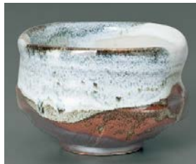
80308-088 青志野手造り抹茶碗(貼箱) 4,600円 (120×85mm)