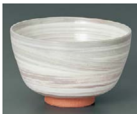
80312-128 刷毛目抹茶盃(化) 3,570円 (120×75mm)