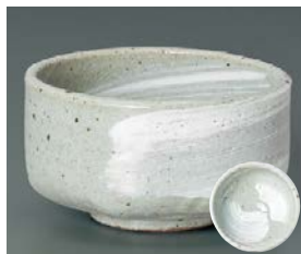
80329-058 白刷毛抹茶碗(小) 840円 (100×60mm) 80330-058 白刷毛抹茶碗(大) 1,700円 (125×75mm)