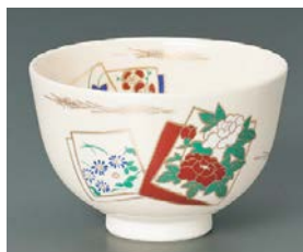
80316-128 仁清色紙抹茶碗(化) 3,900円 (123×79mm)