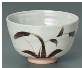
80313-128 唐津抹茶盃(化) 3,570円 (121×75mm)