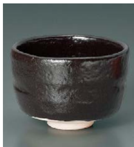
80216-458 黒楽茶盃(木)匠楽作 6,500円 (115×80mm)