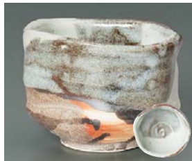
80306-088 鼠志野うのふ手造り抹茶碗(貼箱) 4,600円 (120×85mm)