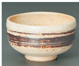
80323-438 イラボ鉄刷毛目抹茶碗 2,620円 (130×80mm)