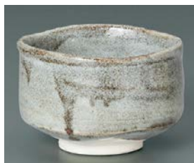
80318-218 青志野抹茶碗(化) 3,000円 (112×80mm)