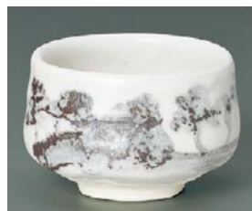
80320-218 白志野山水抹茶碗(化) 3,000円 (112×80mm)