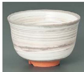
80305-128 割高台刷毛目抹茶碗(化) 4,500円 (123×79mm)