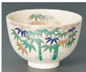
80317-128 仁清青竹抹茶碗(化) 3,900円 (125×80mm)