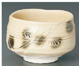
80319-218 黄瀬戸抹茶碗(化) 3,000円 (112×80mm)