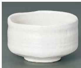
80328-228 粉引抹茶(トムソン箱) 1,500円 (120×70mm)