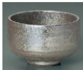
80325-438 黒窯変抹茶碗 1,760円 (120×78mm)