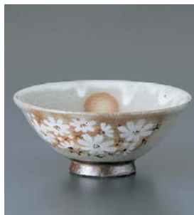
80222-458 御本手秋桜花茶盃(木)菊陶作 6,500円 (140×55mm)