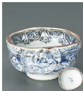
80218-088 祥瑞福良碗(貼箱) 6,500円 (115×105×65mm)