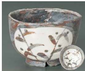
80309-458 鼠志野草紋抹茶盃(化) 3,500円 (116×80mm) 手造り