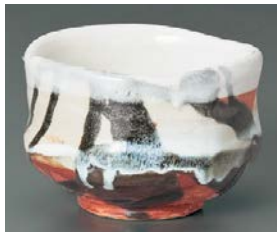
80307-088 志野黒流手造り抹茶碗(貼箱) 4,600円 (120×85mm)