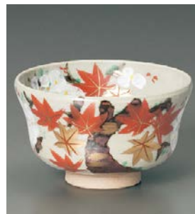
80215-128 雲錦抹茶碗(化) 5,600円 (123×75mm)