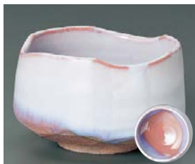
80327-278 ウス萩抹茶碗(トムソン箱) 1,550円 (120×75mm)