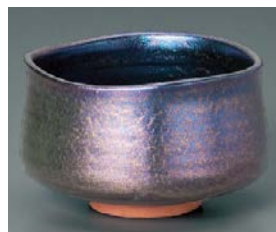
80315-108 虹彩黒角抹茶碗 3,200円 (125×75mm)