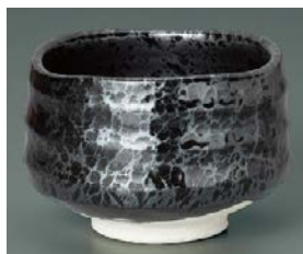
80321-218 油滴天目抹茶碗(化) 3,000円 (112×80mm)