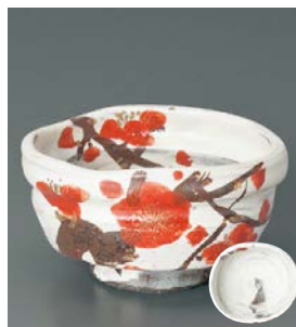
80219-088 梅福良碗(貼箱) 6,500円 (120×110×60mm)