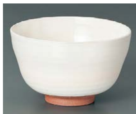
80314-128 御本手抹茶盃(化) 3,570円 (124×75mm)