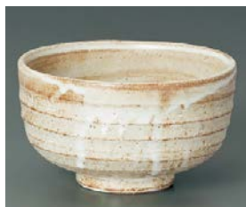
80324-438 白窯変抹茶碗 2,620円 (128×75mm)