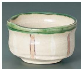
80304-338 瀏織部十草抹茶碗(化) 5,300円 (128×70mm)