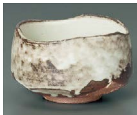
80326-278 灰釉吹抹茶碗(トムソン箱) 1,550円 (120×75mm)