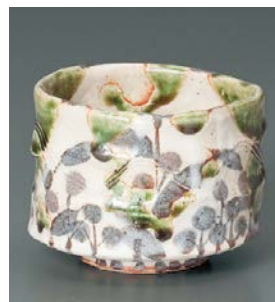
80220-088 保夫窯織部華文一口抹茶碗(貼箱) 6,200円 (95×78mm)