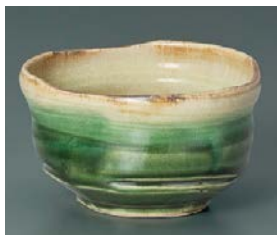
80302-338 織部かすみ抹茶碗(化) 5,300円 (128×70mm)